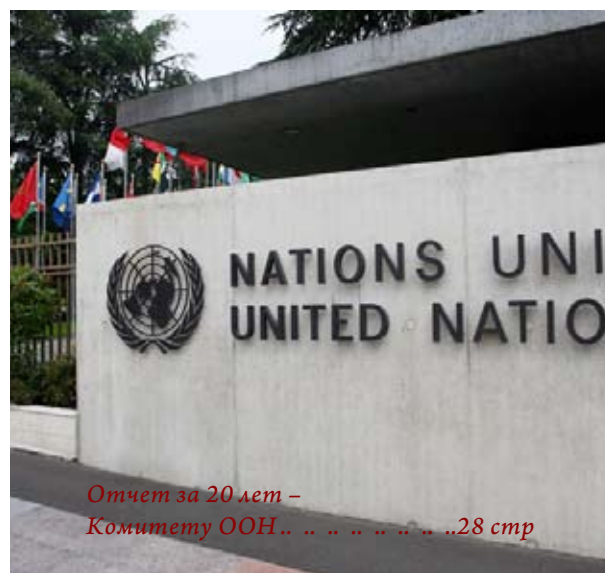
Отчет за 20 лет – Комитету ООН.. . . . 28 стр