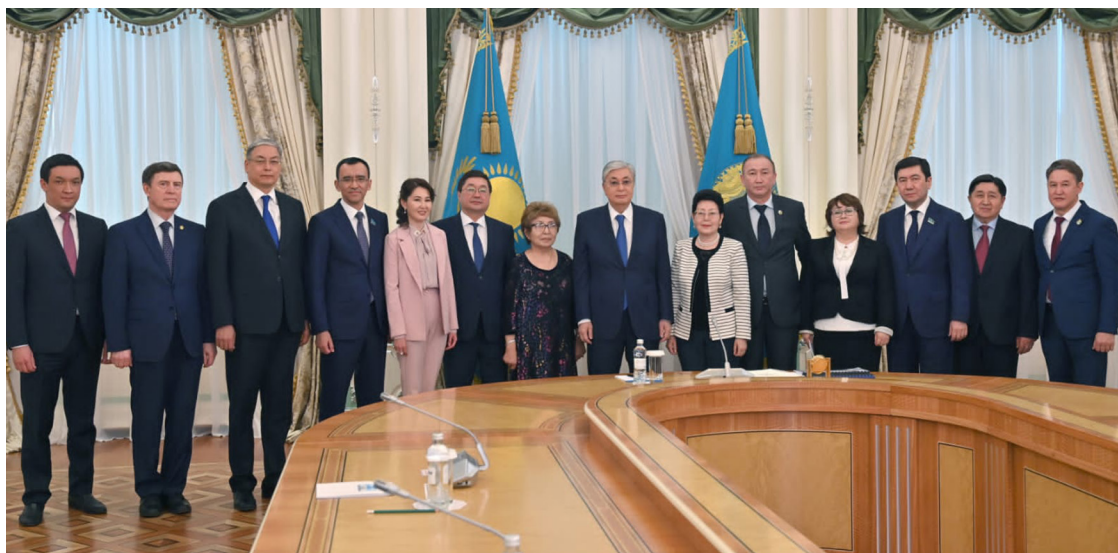
ҚР Президенті Қ.-Ж.К. Тоқаевтың

Ғалымның мемлекеттік дәрежедегі белсенділігінің бірден бір дәлелі елімізде болған соңғы өзгерістер. Нақты айтқанда, Е.Ә. Оңғарбаев Қазақстан Республикасының Конституциясына өзгерістер мен толықтырулар енгізу туралы ұсыныстарды әзірлеуге жұмыс тобы мүшесі ретінде ат салысты және қазіргі кезде олардың мазмұнын қоғамға түсіндіруге белсенді қатысуда. 6