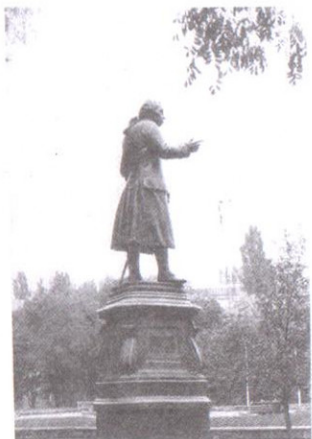
И. Кант ескерткіші Кёнигсбергде орнатылған Х.Д. Раухтың (Rauh) жұмысы