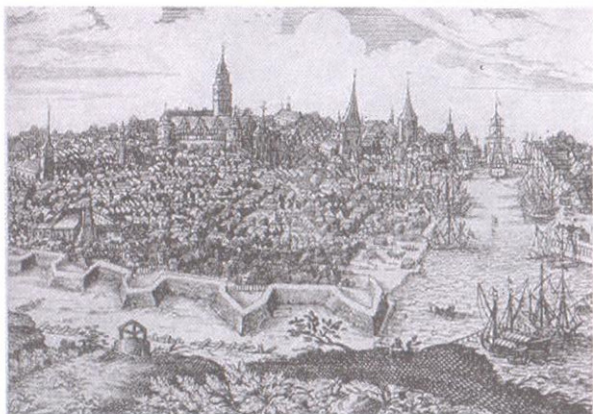
Ескі Кёнигсбергтің планы