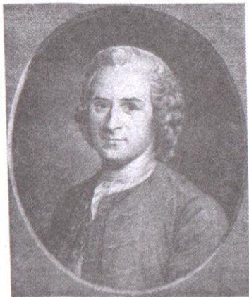
Жан Жак Руссо