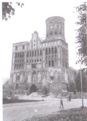
Әр түрлі тарихи кезеңдердегі Кёнигсбергтегі ғибадатхана