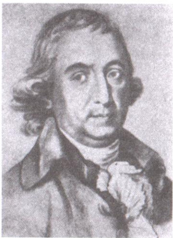
Иоганн Готфрид Гердер