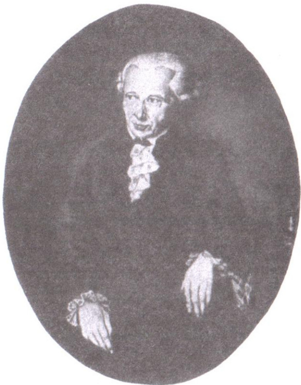
Кант Деблер салған портрет