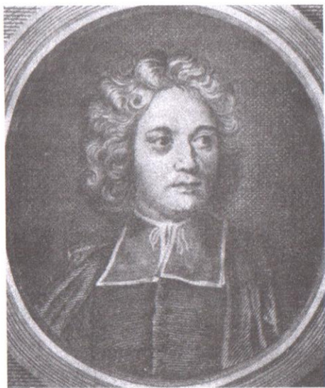
Шарль Ирине де Сен-Пьер