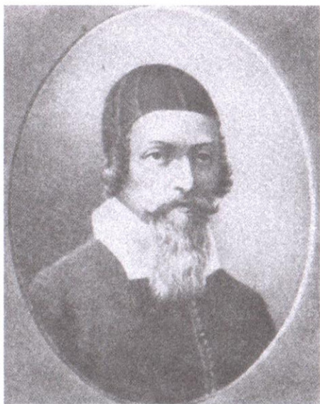
Ян Амос Коменский