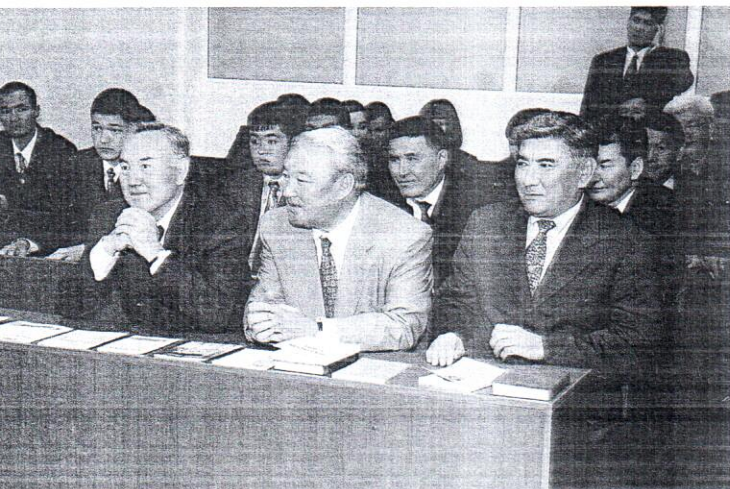
Келелі кеңес үстінде

- Жұмыс нәтижелі болу үшін жұмысшылардың тамағы тоқ, көйлегі көк болсын дейді ғой. Сол секілді, алғашқы келген үш айдың ішінде оқытушылардың еңбекақысын зерттедім. Сөйтсем, ұстаздар университеттегі бухгалтерден, кадр бөлімінің бастығынан, шаруашылық бөлімінің бастығынан әлдеқайда кем алады екен. Жарты жылға жеткізбей-ақ ұстаздардың айлығын 2-3 есеге көбейттім. Одан кейін 45 пәтерлі үй салдырып, оның 39-ын мұғалімдерге бергіздім. Енді Астанада 25 пәтерлік үй салдырып жатырмыз. Амандық болса, ол да мұғалімдердің еншісіне тимек.