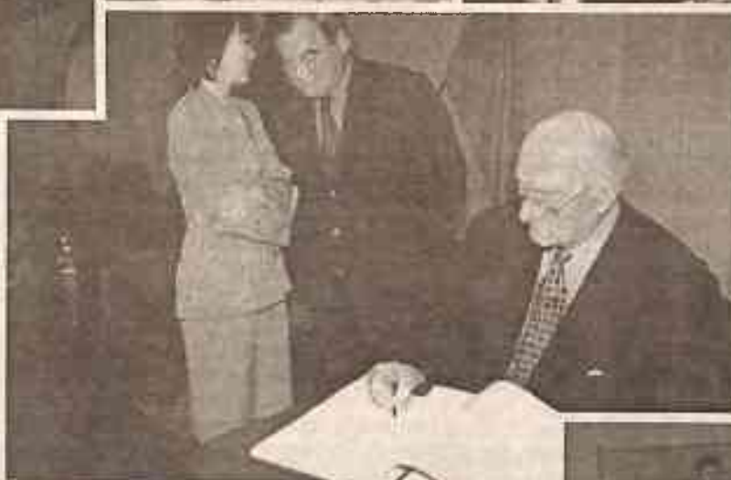
Президент Парламентской Ассамблеи Совета Европы лорд Рассел Джонстон: памятная запись в Книге почетных гостей КазГЮА