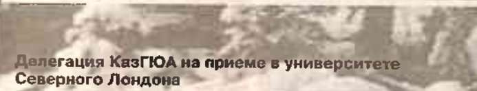
Делегация КазГЮА на приеме в университете Северного Лондона