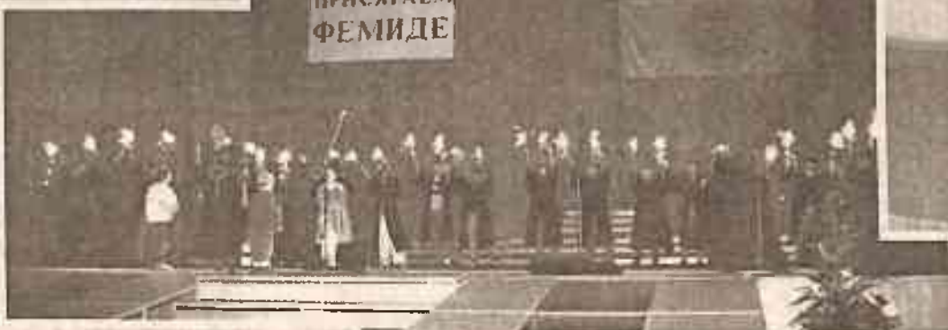
Присяга Фемиде Дворец Республики