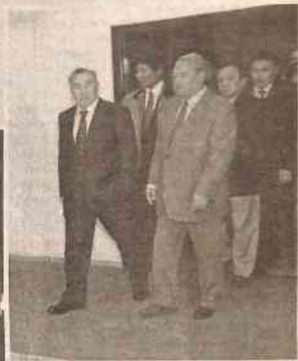
Президент Республики Казахстан Н.А.Назарбаев в КазГЮА, г. Астана