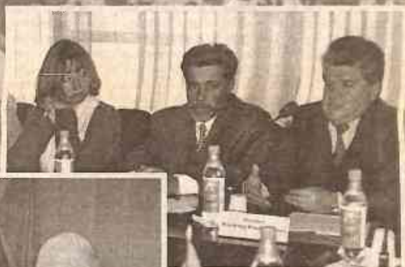
Представители ООН в КазГЮА