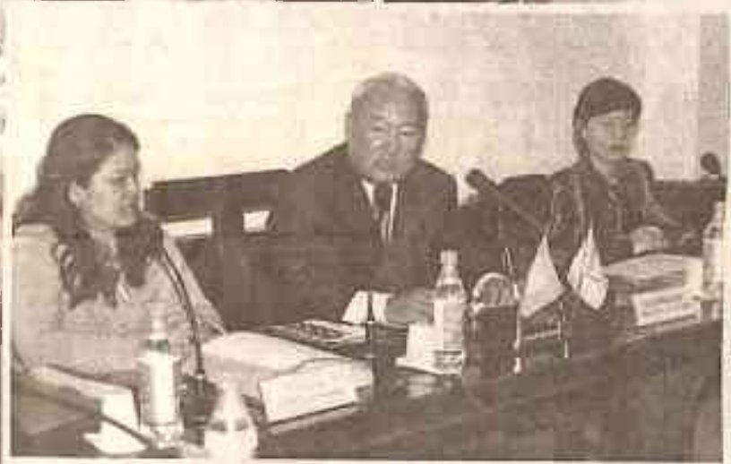
Международная конференция "День ООН в КазГЮА"