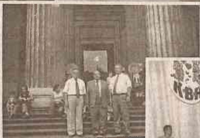
Делегация КазГЮА в Британской библиотеке Лондон