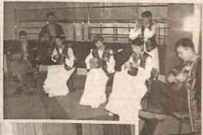
Студенческий оркестр народных инструментов КазГЮА