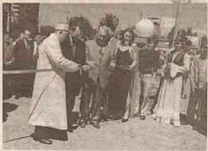
Открытие площади Фемиды в г. Алматы