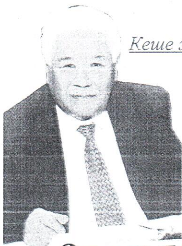
Рахымжан ЕЛЕШЕВ, академик: