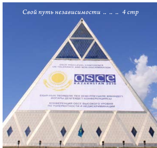
Свой путь независимости .. . . . 4 стр