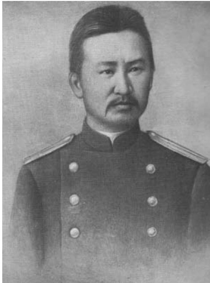
БарлыбекСыртанов. 1908 год. Город Верный Из книги: С. Өзбекұлы. Барлыбек Сыртанов. Алматы: Жеті жарғы, 1996. – 112 б.

в разрез существующему закону... 800 тысячное киргизское население Семиреченской области приходит в отчаяние, не находя защиты своих законных, кровных интересов и вынуждено просить о наделении их землей в размере хозяева оседлого населения, хотя это грозит разорением кочевого хозяйства и грозящего нищетою 800 тысячному населению и номадному краю». 26 Для того, чтобы остановить подобную практику царского правительства 21 октября 1910 г. Б. Сыртанов приложил усилия для организации общественного движения на территории Узунагашской волости. 27 В 1911 г. несмотря на болезнь, Сыртанов отправляется в Санкт-Петербург, чтобы доставить в Сенат прошение народов Жетысу – казахов, киргизов, сартов, ногайцев о прекращении насильственного присвоения их земель царским правительством.