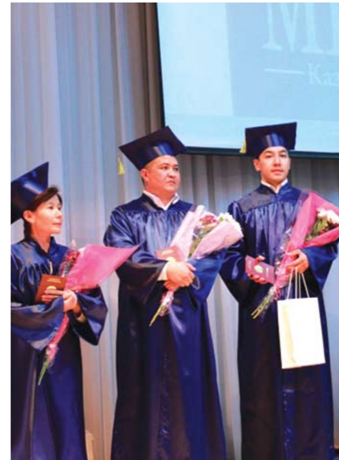
ҚазГЗУ MBA түлектері (22.06.2013)

Ұлтымыз «Кездеген мақсатқа: бауырлап жылжып жылан да жетер, самғай ұшып қыран да жетер», - дейді. Биік мақсаттарды бағындыру, «Жеті Жарғыны» бекіткен Тәуке ханның көшжолында бой көтерген Қазақ гуманитарлық заң университетінің еншісінде болуы заңдылық.