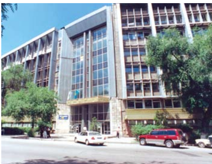
ҚазМЗИ алғашқы ғимараты. Алматы қ., (Абай даңғылы, 50 «а»)