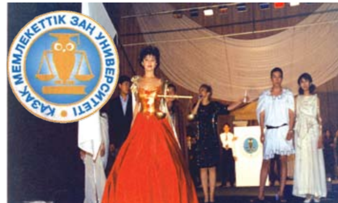
ҚазМЗУ бірінші логотипі мен туының презентациясы. Алматы қ. (23.10.1998)