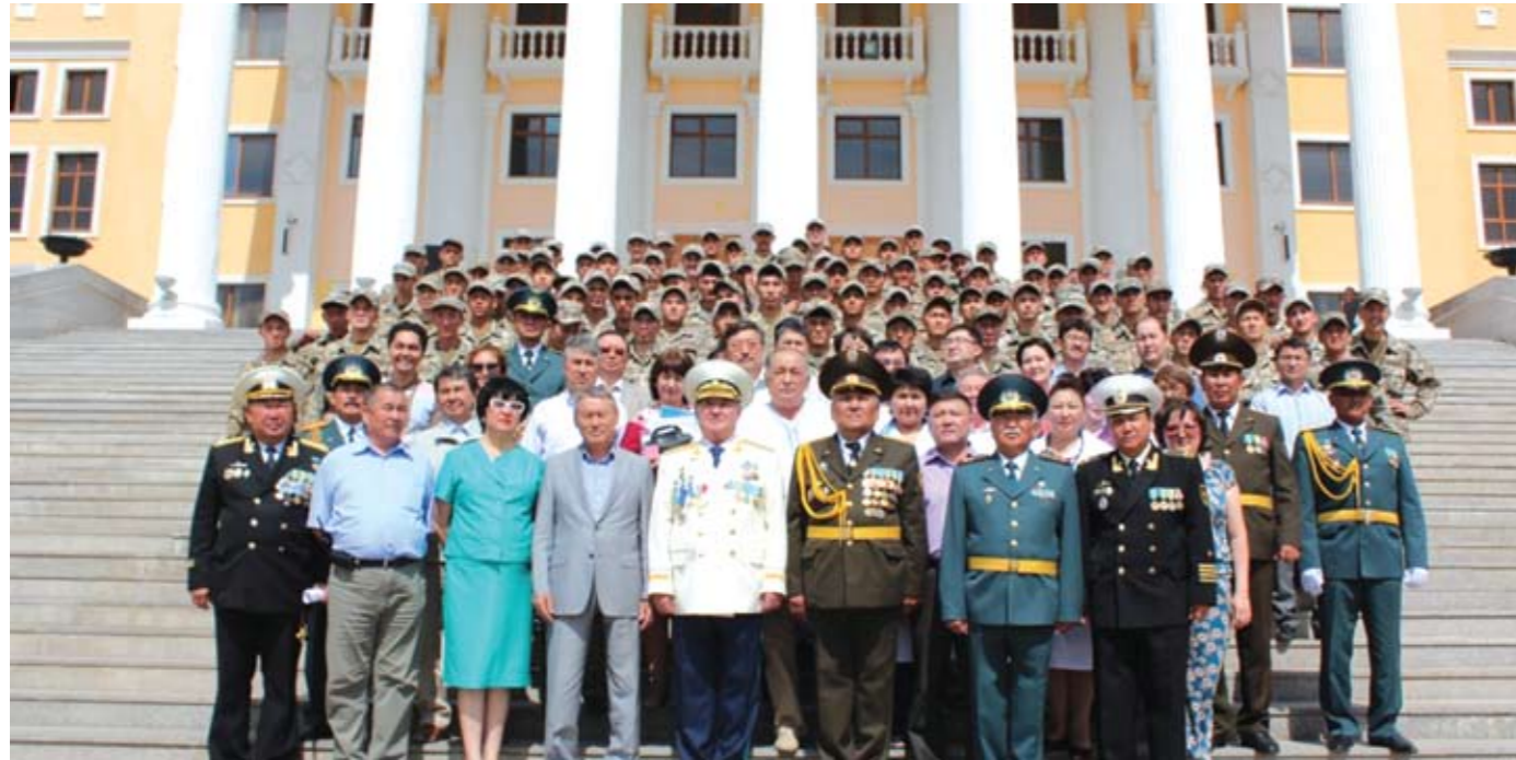
Әскери дайындық кафедрасын аяқтаған курсанттарды құттықтау (29.06.2013).