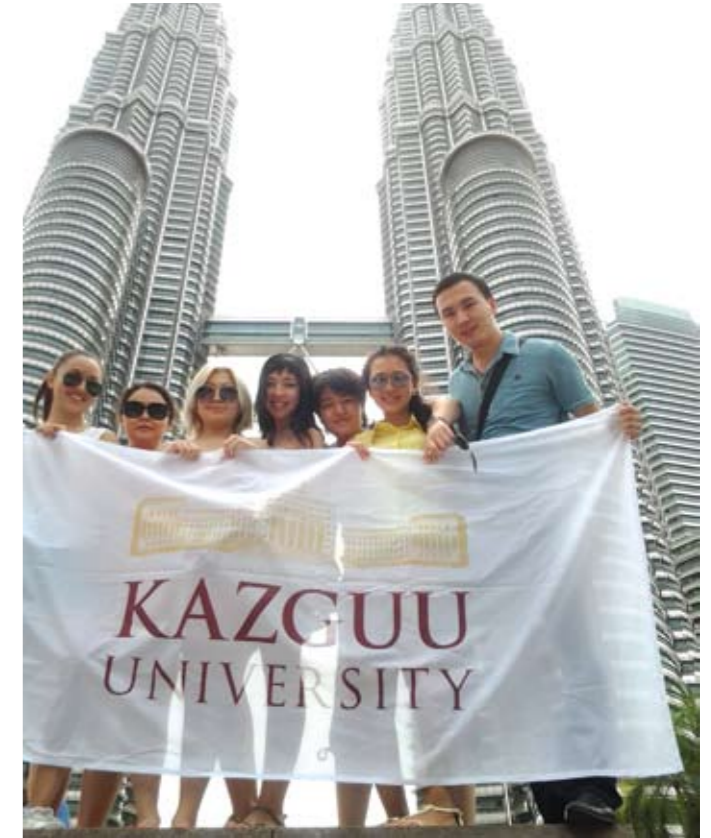
ҚазГЗУ магистранттары Малайзияда ғылыми стажировкада (8-20.01.2014)