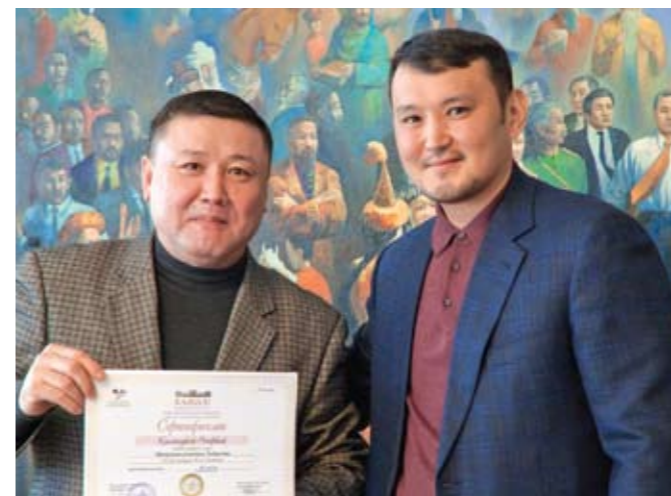
Жетекшілер арасындағы Лидерлікті Дамыту Бағдарламасын тыңдаушыларына сертификаттарды тапсыру. ҚазГЗУ. Астана қ. (25.01.2014)

2012 жылғы БЖҒМ ұлттық аккредитациялық орталығы рейтингі көрсеткішімен, ҚазГЗУ «Юриспруденция» мамандығы бойынша