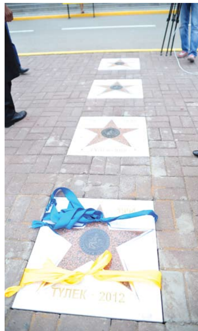
Дәстүр жалғастығы, ҚазГЗУ «Түлектер Аллеясында» өткен кезекті бітірушілер кеші. Астана қ. (04.07.2012)