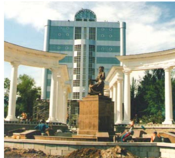
ҚазМЗА «Фемида» алаңының құрылысы. Алматы қ. (2001)