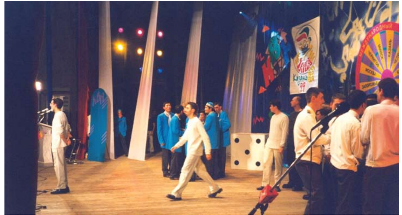
ҚазМЗУ командасы КВН Халықаралық Одағы Бірінші Лига ойынында. Қазан қ. (1999)