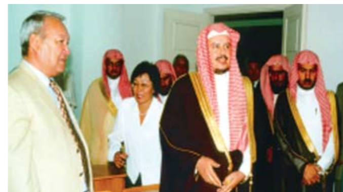
ҚазГУ қонағы Сауд Араб Королдігі делегациясы: доктор Абдалла бин Мухаммед бин Ибрагим Әл Аш-Шейх – Сауд Араб Королдігі Әділет министрі. Алматы қ. (2002)