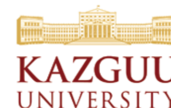
2013 жылы ҚазГЗУ ректоры Нәрікбаев Т.М. бекіткен университеттің жаңа логотипі

2009-2012 жылдары халықаралық кездесулер: МККК (халықаралық