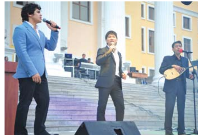
«Мұзарт» эстрада жұлдыздарының өнер көрсетуі. Астана қ. (04.07.2012)