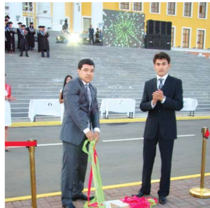
ҚазГЗУ «Түлектер Аллеясының» ашылуы және алғашқы «жұлдызды» кірпішінің төселуі. Астана қ. (09.07.2009)