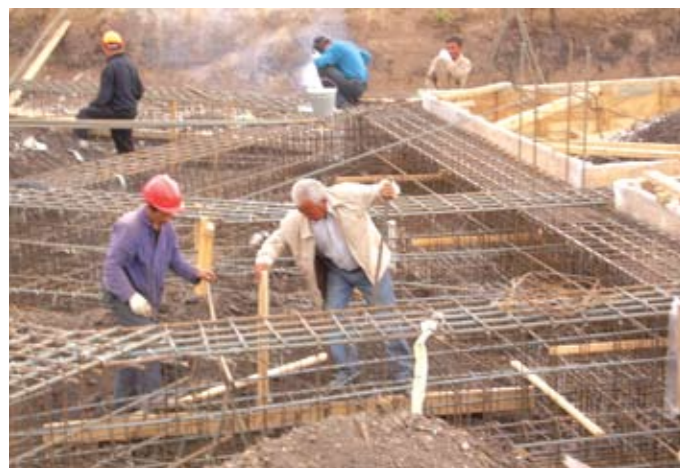
ҚазГЗУ оқу ғимараты құрылысының алғашқы жылы. Астана қ. (06.08.2006)