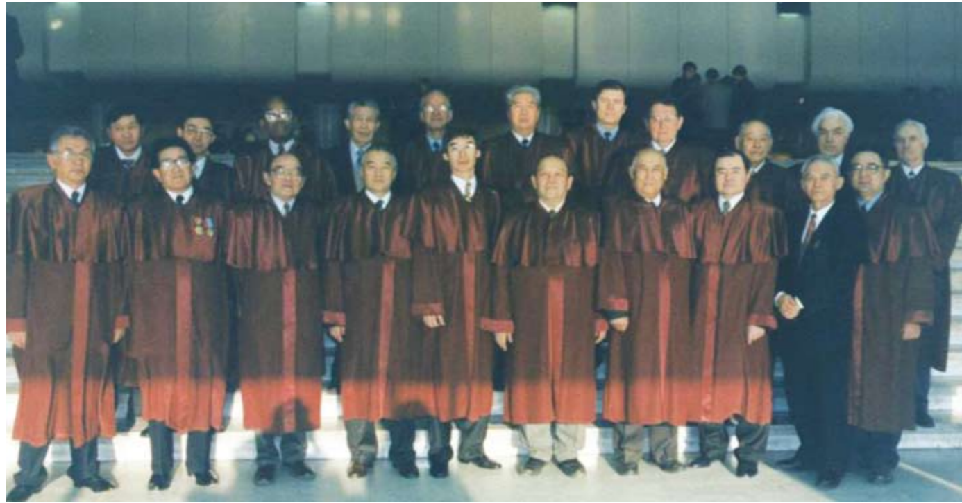
ҚазМЗУ профессорларының алғаш мантиямен шығуы. Алматы қ. (14.03.1998)