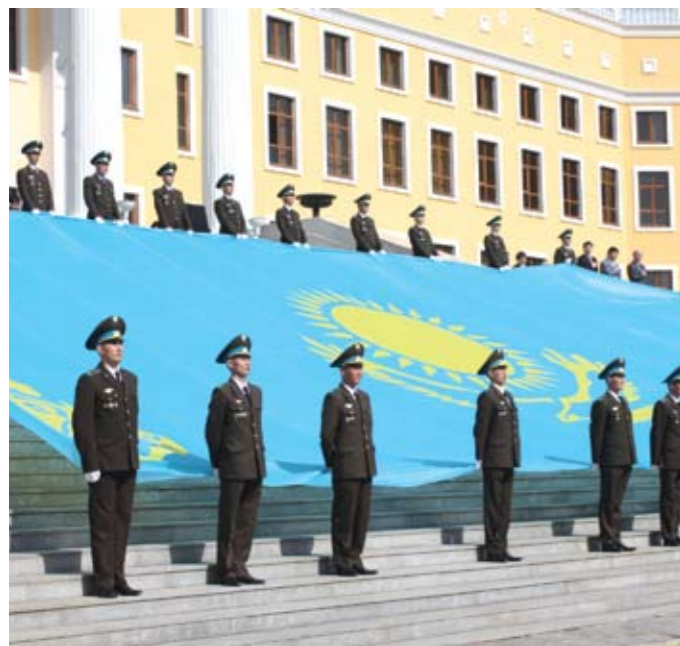
ҚР Тәуелсіздігінің 20 жылдығына арналған университет іс-шарасынан. Астана қ. (16.12.2011)