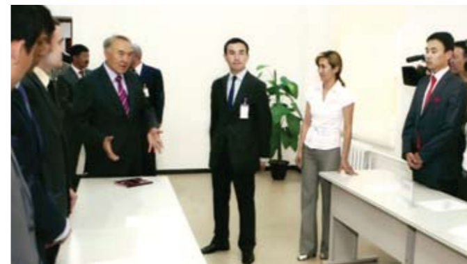
ҚР Президенті Назарбаев Н. Ә. ҚазГЗУ Студенттер Парламенті мүшелері ортасында. Астана қ. (02.07.2008)