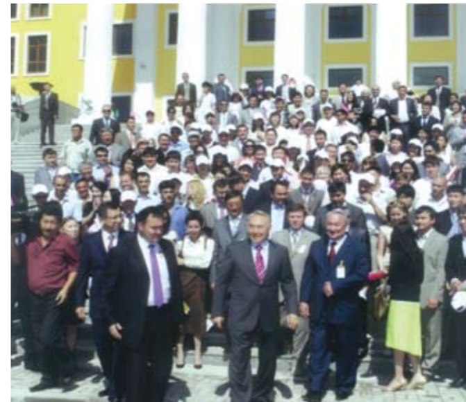
ҚР Президенті Назарбаев Н.Ә. ҚазГЗУ ұжымына жаңа ғимаратта жаңа табыстарға жетуді табыстады. Астана қ. (02.07.2008)