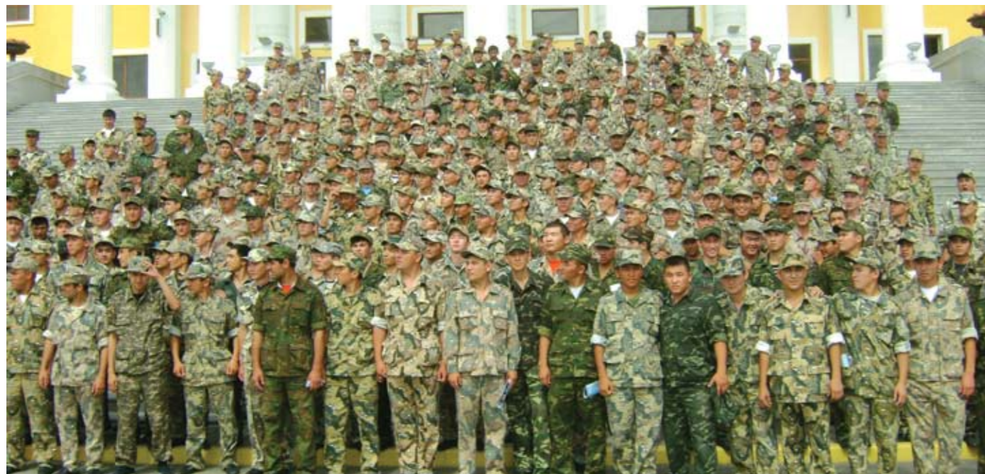
ҚазГЗУ «Түлектер Аллеясында» өткен Әскери дайындық кафедрасы курсанттарының ант қабылдауы. Астана қ. (18.07.2009)