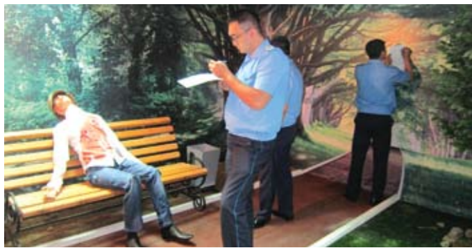
ҚазГЗУ Сот экспертизасы институтының тыңдаушылары. Астана қ. (17.06.2014)

«ҚазГЗУ» АҚ Директорлар кеңесі отырысының шешімі негізіндегі