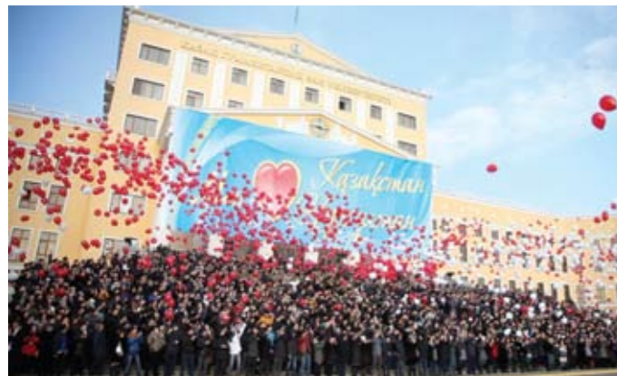
ҚазГЗУ студенттерінің ҚР Президентін «Президент күнімен» құттықтау іс-шарасы. Астана қ. (01.12.2013).

2011 жылдың 1 желтоқсанында ҚазГЗУ қабырғасында Сот экспертизасы орталығы ашылып, 2012 жылы орталық негізінде Сот экспертизасы институты құрылды.