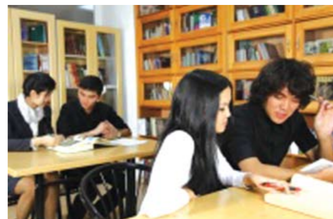
ҚазГЗУ студенттері «Профессор Нәрікбаев М.С. жеке кітапханасы» залында. Астана қ. ( 2010)