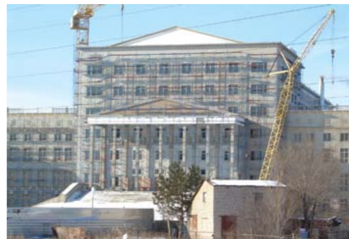
Құрылыс жұмысының екінші жылы. Астана қ. (07.09.2007)