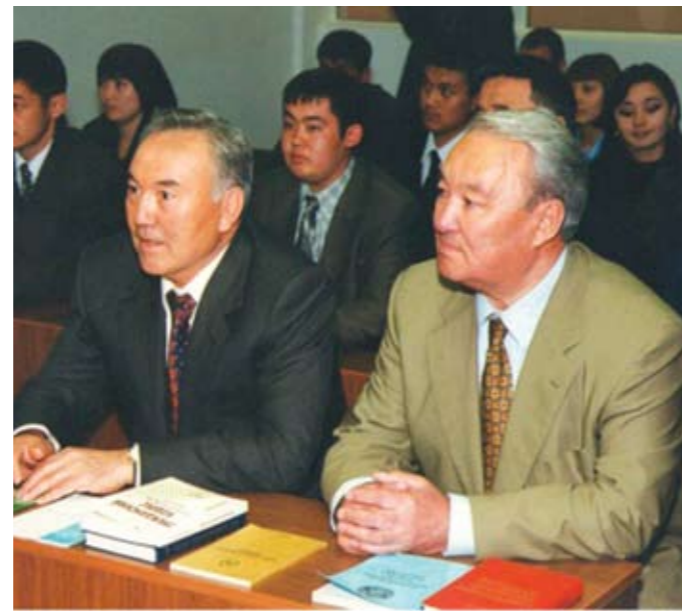
ҚР Президенті Н. Ә. Назарбаев ҚазМЗА балансына берілген ғимаратта. Астана қ. (11.06.2001)