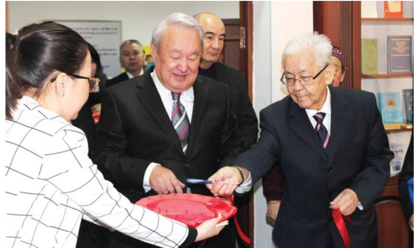
ҚазГЗУ-де «Академик Баймаханов М.Т. аудиториясының» ашылу салтанатынан. Астана қ. (12.03.2014)