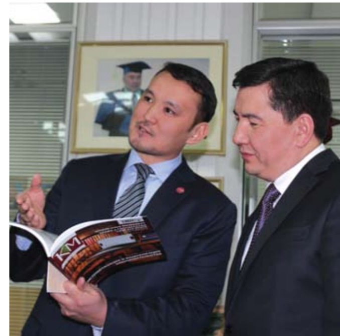
ҚР Білім және ғылым Министрі Саринжилов А.Б. ҚазГЗУ-ге келген сапарынан. Астана қ. (13.03.2014)