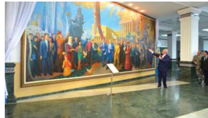
ҚазГЗУ С. Зиманов атындағы академиясы мен 2 кеңкөлемді пано тұсаукесері. Астана қ. (06.10.2012)