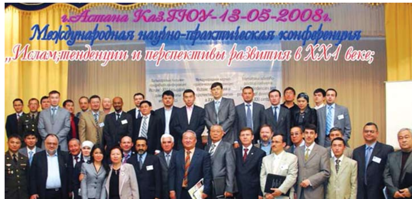
ҚазГЗУ ұйымдастыруымен өткен «Ислам: 21 ғасырдағы даму ағымдары және перспективалары» Халықаралық конференция қатысушылары. Астана қ., (13-15.05.2008)