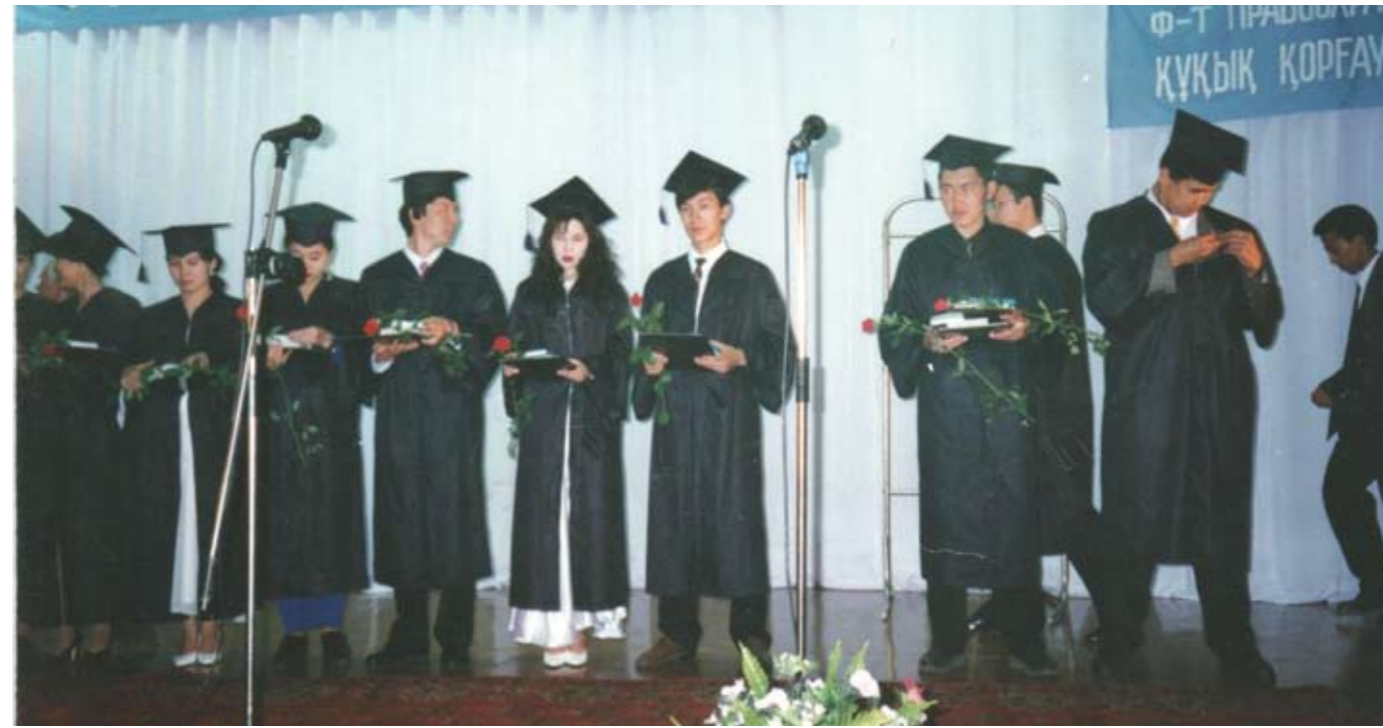
ҚазМЗИ тұңғыш түлектері. Алматы қ. (18.06.1996)