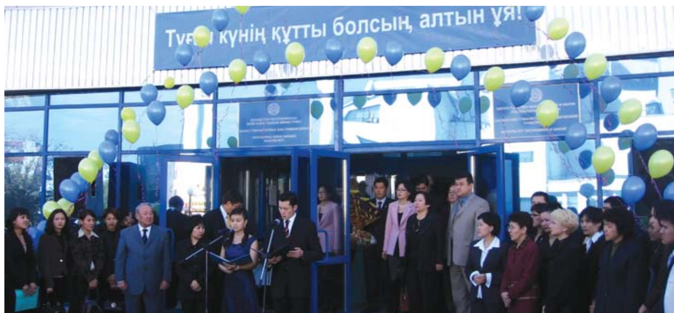
Астана қ. ҚазГУ экономика және бизнес факультетінің ашылуы (2005)