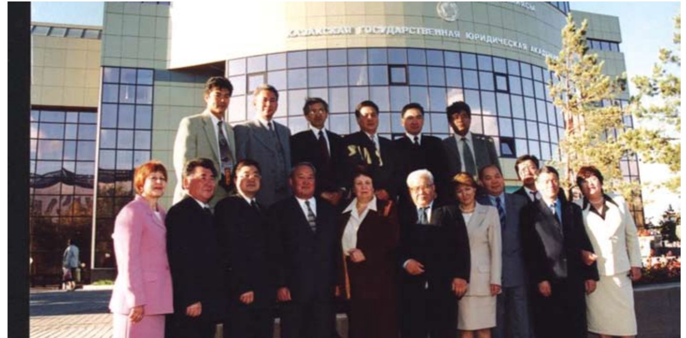
Астана қаласына ауысқан оқу орнының алғашқы әкімшілік-басқару құрамы (2002)

2000 жылдың 26 шілдесінде ҚР Бас Прокуроры (1995-1996 жж.), ҚР Жоғарғы Сотының Төрағасы (1996-2000 жж.) лауазымдарында болған з.ғ.д., профессор Нәрікбаев Мақсұт Сұлтанұлы ҚР Білім және ғылым министрлігінің бұйрығымен ҚазМЗА ректоры болып тағайындалады.