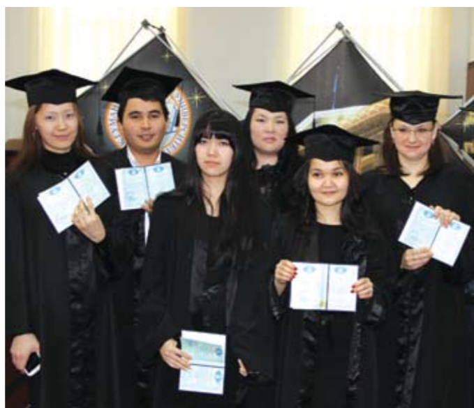
ҚазГЗУ кешкі бөлім бітірушілерінің диплом алу күні (28.12.2013)