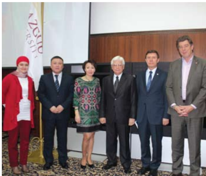
Ресей Федерациясының төтенше және құзыретті елшісі М. Н. Бочарниковтың ҚазГЗУ-ге келуі. (Сәуір, 2014 ж.)

федрасы; конституциялық құқық және мемлекеттік басқару кафедрасы кіреді.