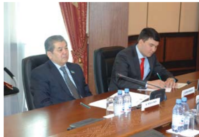
На заседании круглого стола (2013 г.)