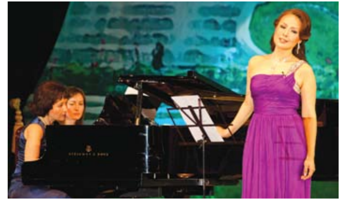
Вальс Мюзетты из оперы Джакомо Пуччини «Богема» «Quando m'en vo» (2012 г.)

1. КазГЮУ – один из первых вузов, созданных в независимом Казахстане, за 20 лет в университете сложились собственные академические и научные традиции. КазГЮУ выпустил столько специалистов, которыми вуз может гордиться по праву и которые по праву гордятся своей Альма-матер. Это здорово. Наверное, я не могу говорить за всех выпускников, но возвращаясь к выпуску 2001 г., хочу сказать, что о своих однокурсниках и о своем родном вузе всегда отзываюсь с гордостью. Благодаря вузу я