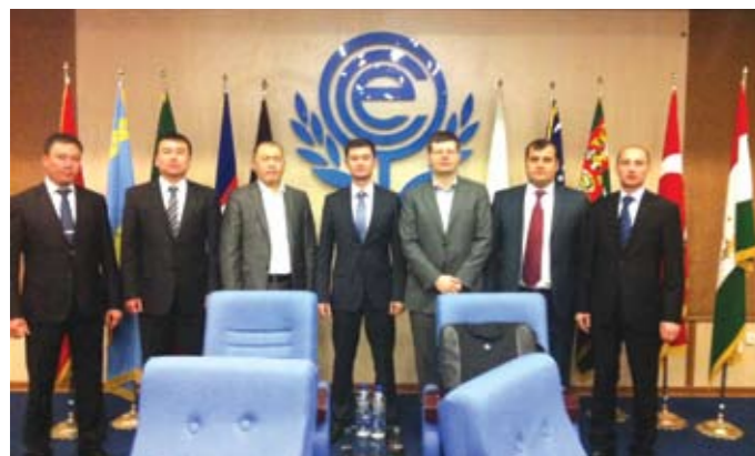
Международная конференция, организованная ООН, по вопросу противодействия отмыванию денежных средств добытых преступным путем. Тегеран, 2013 г.

Получив свой первый диплом и начав поиск будущей работы, на собеседованиях с руководством государственных органов, я с гордостью отвечал на вопрос: «А какой ВУЗ Вы закончили?».