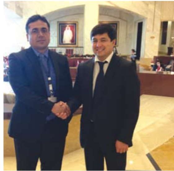
На международной конференции Global Finance Re-Designed: The Euromoney Qatar Conference, Доха (Катар) (2012 г.)