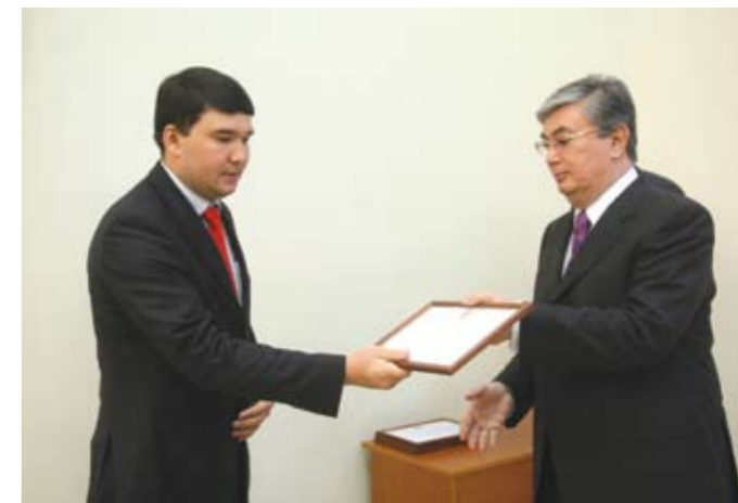
Вручение Почетной грамоты Сената Парламента РК (2009 г.)

2. Самым положительным образом! Навыки, приобретенные в стенах Альма-матер, очень помогли в реализации многих проектов. Юридическое образование дает мне некую профессиональную основу. Это важно. Я могу самостоятельно и обоснованно