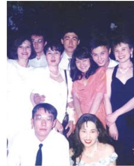
Выпускной вечер (1996 г.)