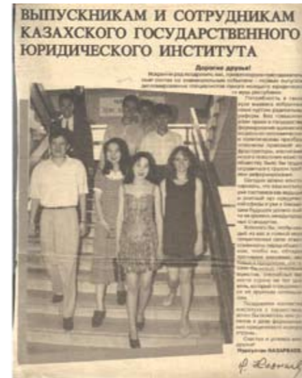
«Юридическая газета» от 10 июля 1996 г. №51(103). Слова напутствия Н. А. Назарбаева первым выпускникам КазГЮИ

2. Мы, первый выпуск Казахского государственного юридического института, были свидетелями его создания. КазГЮИ был образован Указом Президента Республики Казахстана в 1994 г.