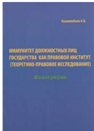
Кишкембаев А. Б. Монография. «Иммунитет должностных лиц государства как правовой институт (теоретико-правовое исследование)» (2011 г.).

Автор более 40 публикаций по актуальным проблемам юриспруденции, в том числе учебного пособия и монографии.