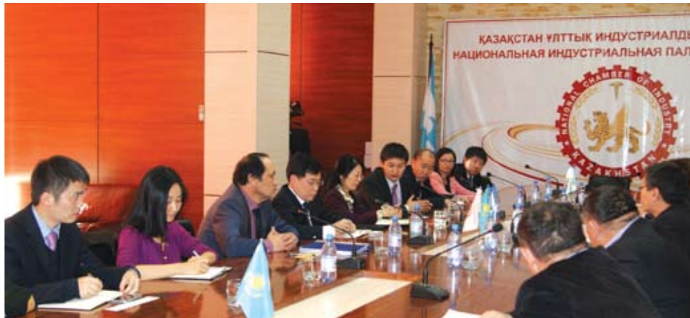
Обсуждение вопросов казахстанско-китайского сотрудничества в сфере поддержки МСБ. 20 июня 2014 г.

Как указывается в литературе, в целях стимулирования развития МСП в Японии в 1963 г. был принят «Основной Закон о малых и