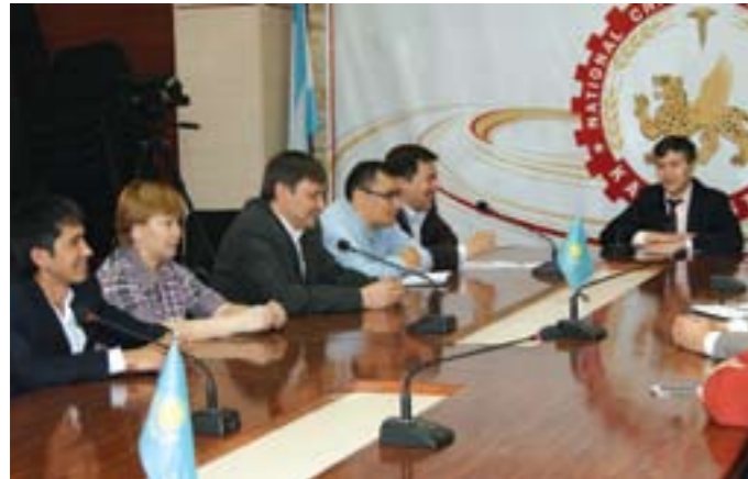
Обсуждение проекта Предпринимательского кодекса на заседании Правления СПП «НИПК»

юридических лица, к которым относятся: государственные предприятия, хозяйственные товарищества, акционерные общества, производственный кооператив.