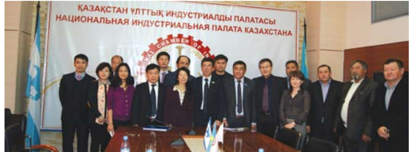
Встреча казахстанских и китайских бизнесменов в СПП «НИПК» по вопросам сотрудничества в сфере развития МСБ. 20 июня 2014 г.

номического, торгово-производственного и, отчасти, валютно-финансового законодательства, предназначенного для регулирования весьма широкого круга организационно-экономических, производственных, корпоративных, договорных, торговых и различного рода иных деловых отношений. Наряду с этим в нем даже имеются нормы уголовного закона, предусматривающие меры уголовного наказания за совершение определенных противоправных деяний в сфере экономики и предпринимательства. 5