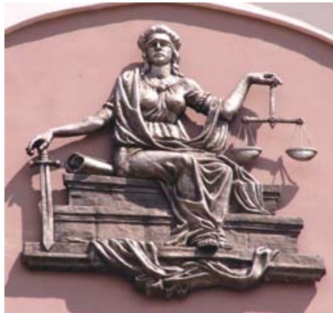
Фемида — символ правосудия

отношение является, таким образом, второй стадией реализации фактического общественного отношения, опосредованно материальным правовым отношением.