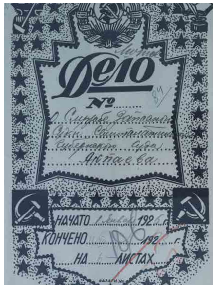
ЦГА РК Ф. 1541. Оп. 1л. Д. 172. Тит. лист.