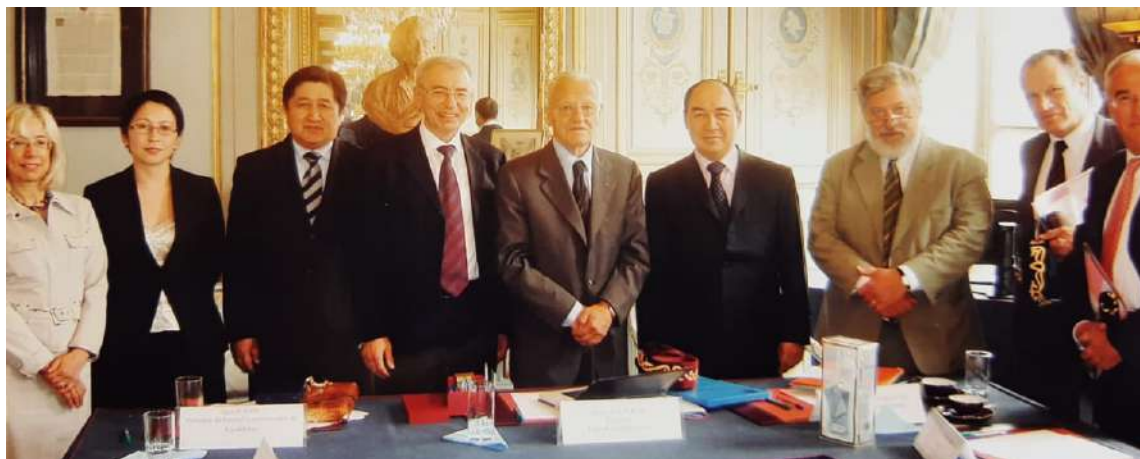
Францияның Конституциялық кеңесінде

«Ұлы даланың барлық бұрыштарында лайықты ұлдар дүниеге келді. Алайда, әділетсіздігі олардың көпшілігінің есімдері бізге белгісіз екендігінде жатыр. Тиісті ақпараттық қамтамасыз етусіз тарихи жад өте қысқа»-деп, әлі де болса, елімізге әртүрлі сала бойынша еңбегі сіңген азаматтарымыз көп дейді ғалым. 3