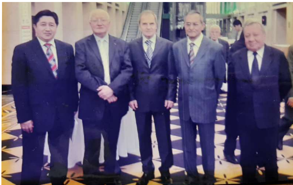
В. Д. Зорькин және Халықаралық заң Форумына қатысушылармен. Санкт-Петербург қ.